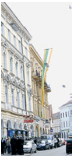
(rechts) Der Eingang des Hauses der Akademische Sängerschaft Gothia zu Graz