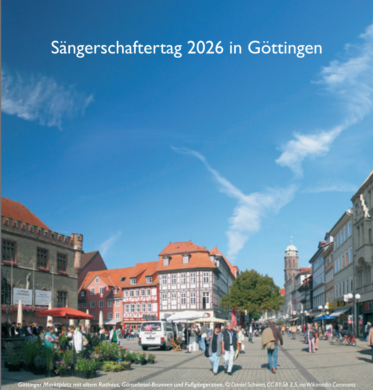
Göttinger Marktplatz mit altem Rathaus, Gänseliesel-Brunnen und Fußgängerzone.