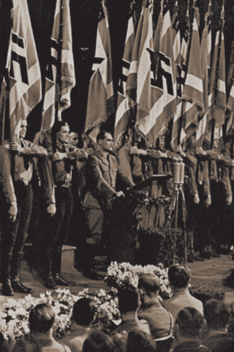
Fahnenweihe aus Anlaß des 10-jährigen Bestehens des NSDStB am 26. Januar 1936